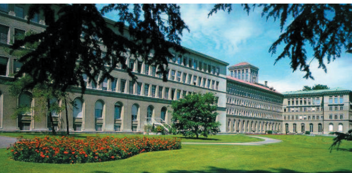
Welthandelsorganisation WTO in Genf: Vermeidung von Handelskriegen