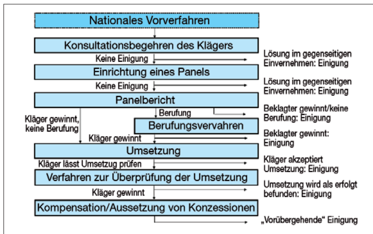
Ablauf eines WTO-Streit-schlichtungsverfahrens: Vereinfachte Darstellung

Wird eine Verletzung von WTO-Recht festgestellt, muss die beklagte Regierung die Berichte umsetzen, was in der Regel eine Beseitigung der rechtswidrigen Maßnahmen erfordert. Hierfür kann, sofern eine sofortige Umsetzung nicht möglich ist, eine „vernünftige Frist“ von normalerweise höchstens 15 Monaten