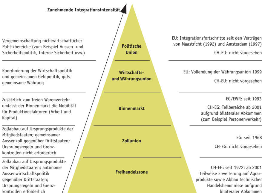
Typen regionaler Integrationsabkommen am Beispiel EU und CH-EU