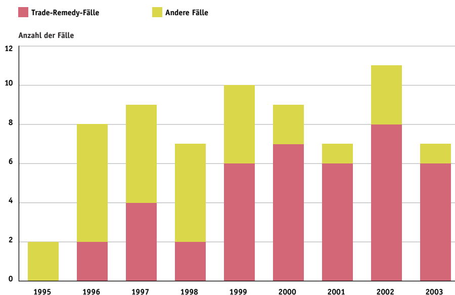
USA als Beklagte in der WTO-Streitschlichtung: Art der Klagen