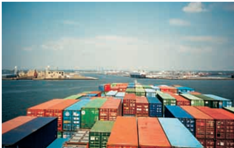
Die Betonung des Sicherheitsaspekts seit den Terroranschlägen vom 11. September 2001 hat sich in zahlreichen neuen Regeln für den Zugang zum US-amerikanischen Markt niedergeschlagen, darunter die 24-Stunden-Regel für Schiffsfracht. Im Bild: Containerschiff bei der Anfahrt auf den New Yorker Hafen.

In den letzten Jahren haben sich die aussenwirtschaftspolitischen Parameter der USA teilweise stark geändert. Drei augenfällige Trends bestimmen seither die US-amerikanische Aussenwirtschaftspolitik: Erstens fließen Sicherheitsüberlegungen seit den Terroranschlägen vom 11. September 2001 massiv in aussenwirtschaftliche Regelungen ein; zweitens schenken die USA der regionalen und bilateralen Ebene bei der Aushandlung internationaler Wirtschaftsabkommen eine gegenüber früher stärkere Beachtung; und drittens scheint die US-amerikanische Aussenwirtschaftspolitik unter zunehmenden protektionistischen Druck zu geraten. Die neuen Entwicklungen erfordern adäquate Antworten seitens der Haupthandelspartner.